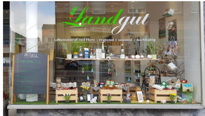
Beispiele für Zwischennutzungen

IMPULS - Die Hammer Wirtschaftsagentur GmbH Anne-Kathrin Jarosz Münsterstraße 5 59065 Hamm