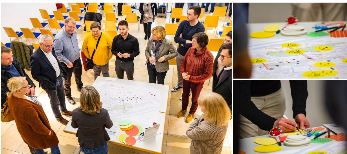
Abbildung 3: Arbeit an den Gruppentischen

Anschließend hatten die Teilnehmer:innen die Möglichkeit, sich an drei Tischen mit jeweils zwei Moderator:innen über die zukunftsfähige Innenstadtentwicklung auszutauschen. Dabei sollten Stärken und Schwächen herausgearbeitet sowie mögliche Maßnahmen benannt werden. Der aktuelle Innenstadtdialog widmete sich räumlich dabei schwerpunktmäßig der historischen Ost-West-Achse in der Innenstadt mit ihren angrenzenden Straßen und Plätzen.